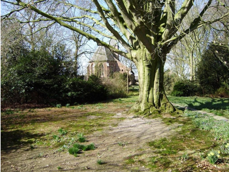
De Apostelboom bij de kerk op Blijdenstein.

bijzondere dingen, zoals bv. een apostelboom, die tussen de kerk en